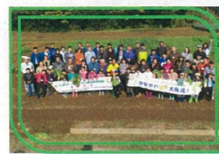
ダイコンの播種体験