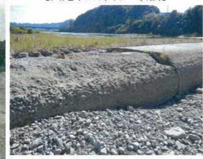
【改修された取水ゲート】