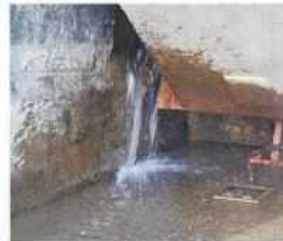
【洪水吐ゲートの漏水】