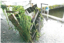
【下流で回収されたゲート】