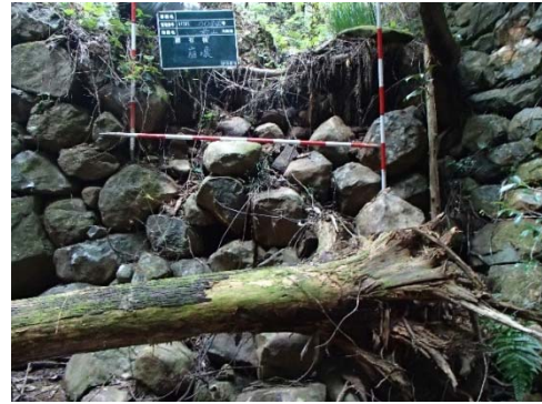
危険度の高いため池②(腰石積の崩壊)