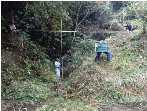
危険度の高いため池①(堤体の崩壊)

③このようなことから、突発的な豪雨や近年多発している大規模地震により決壊の恐れのあるため池を把握し対策を講じるために、平成24年の県営震災対策農業水利施設整備事業を活用し佐賀県、水土里ネットさがが中心となって、県内で一括して管理できるシステムを早急に構築する必要があった。なお、ため池台帳システムは平成26年度完成予定である。