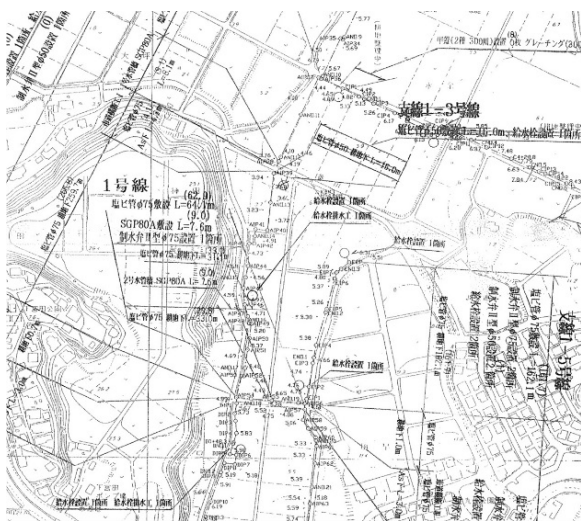
（紙媒体の図面や台帳等による管理）