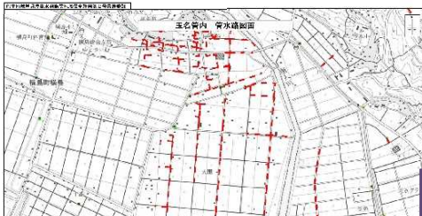
用排水路系統図等