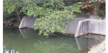
No. 4 洪水吐 ファイル名: 2344600311311124-02.JPG