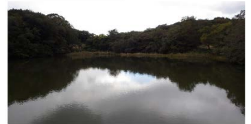
No. 5 堤体の上流全景 ファイル名: 2344600311311125-03.JPG