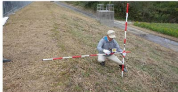
No. 3 散水施設 ファイル名: 2344600311311123-01.JPG