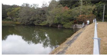
No. 1 堤体の上流側 ファイル名: 2344600311311121-02.JPG